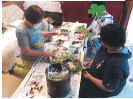
ご近所の人とリース作り