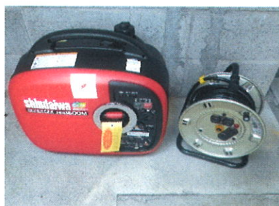
発電機 クローバーの家 つくしの家に一台ずつ設置