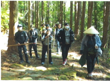
子ども熊野古道体験(松本峠) (2月8日)