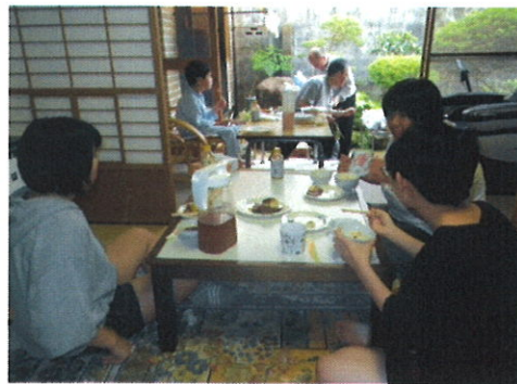
クローバーの家の 中庭でバーベキュー